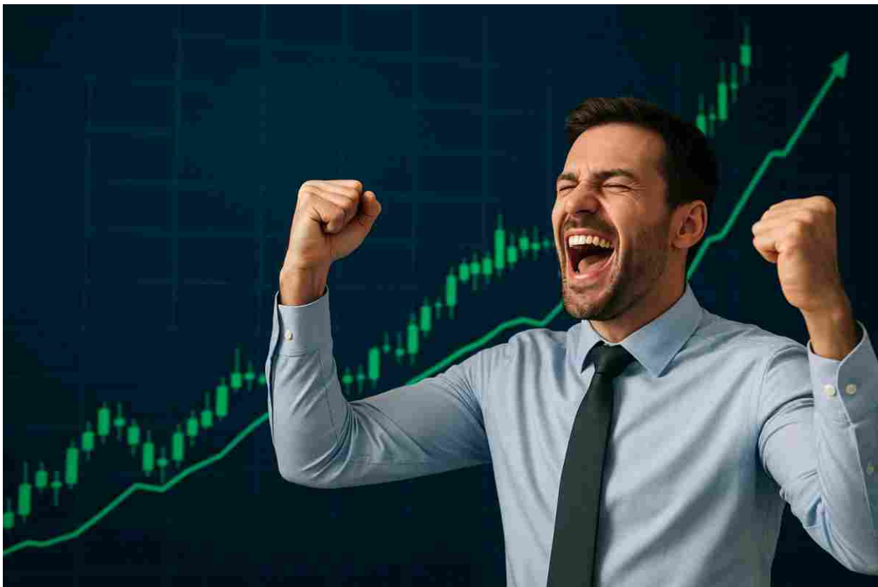
Azioni Kaleon - BorsaInside.com

★ Prova il conto Demo Gratuito su eToro - Subito 100.000€ virtuali ➔